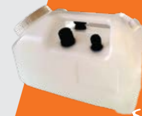
bac à eau