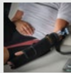
ELLENBOGEN / HANDGELENK