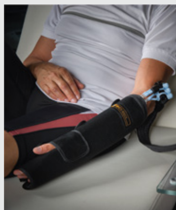
CODO / MUÑECA