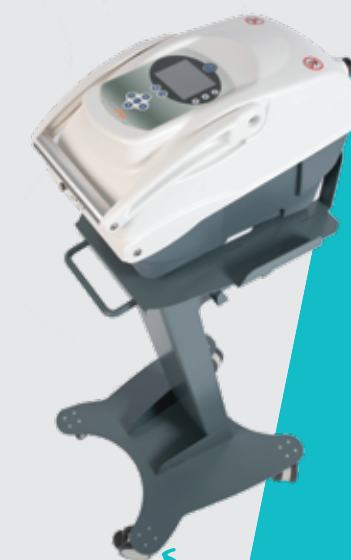
Moove con su consola

Sencillez : el tanque de agua con hielo también se puede preparar en el congelador para prolongar la duración de los tratamientos. Nuestros dispositivos funcionan con red o con batería (5 horas).