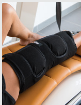
MUSLO (L. 50 CM)