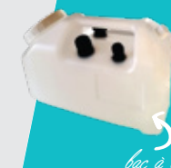
bac à eau