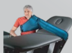
MANGA DEL BRAZO