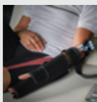
CODO / MUÑECA