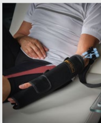
ELLENBOGEN / HANDGELENK