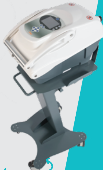
Moove mit seiner Konsole

Einfachheit : Um die Nutzungsdauer zu verlängern, kann der mobile Eiswassertank auch im Gefrierschrank gekühlt werden. Unsere Geräte werden sowohl mit Netzstrom als auch mit Akku betrieben (5 Stunden).