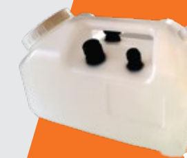
bac à eau