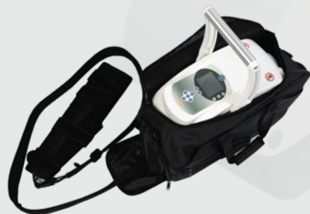
El deporte de Moove con su bolsa de transporte y su férula de rodilla

El agua helada atraviesa la férula, en combinación con una presión de aire continua o alterna, de modo que la temperatura de la piel varía de 30 ° a 6 ° C en promedio, lo que aliviará el área tratada y acelerará la recuperación. Limitar el consumo de drogas y promover el rango de movimiento.